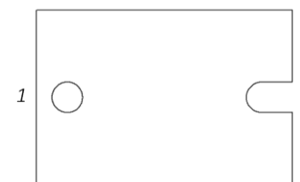
Порядок затягивания винтов: 1 – 2

4.3.2 Диоды крепить к теплоотводу винтами М4 с использованием плоских и стопорных шайб. Последовательность крепления приведена на рисунке 4.