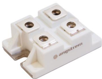
Рисунок 1 – Общий вид модуля

Значения электрических параметров диодов при приемке и поставке приведены в таблице 2.