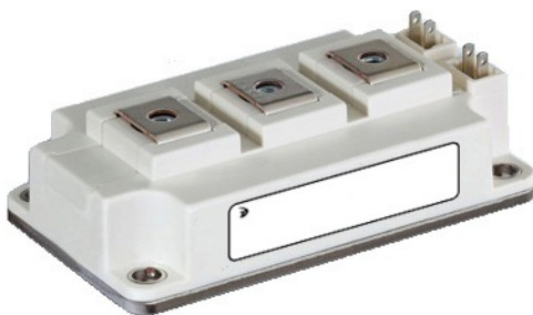
Рисунок 1 – Общий вид модуля

Значения электрических параметров модулей при приемке и поставке приведены в таблице 2.